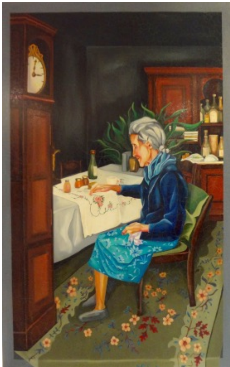
© Gabriela Brunner 2015, Oil on Canvas, "Muetti", 120x190 cm

And with that said; I continue to work with my theme FLOW, creating sculptures and paintings, while I go on my own journey of transition.